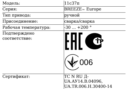
Таблица 1. Характеристики